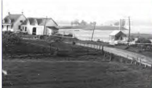
Contexte : Occupation des lieux de l'actuel boulevard Marie-Victorin, vers 1920

Intimement rattaché à l'histoire de Sainte-Catherine, le secteur Kateri occupe une place importante dans l'identité Sainte-Catherinoise. Ses particularités, incluant son cadre bâti, son potentiel archéologique et les aménagements consacrés à la mémoire du lieu témoignent de la relation entre Sainte-Catherine et l'eau au fil du temps.