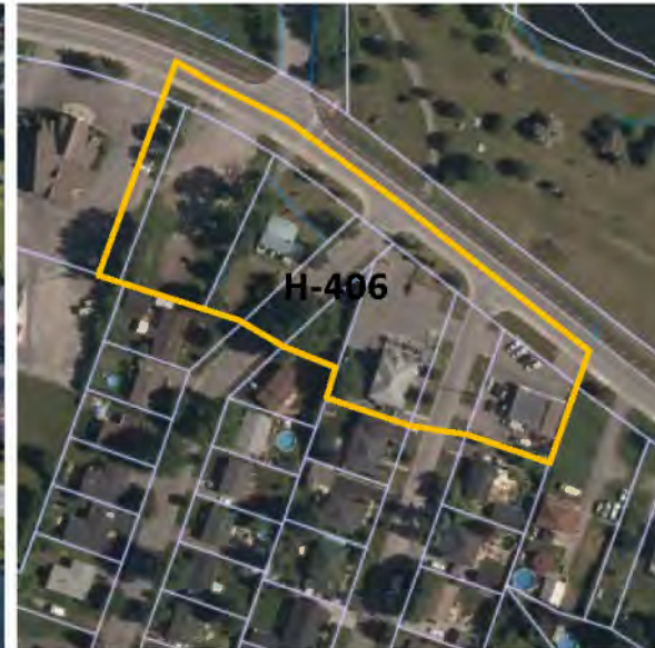
Contexte : Zone H-406