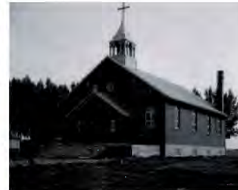
Contexte : Église d'origine (photo 1948)