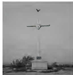
Contexte : Tombeau de Kateri