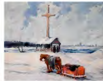
Contexte : Tombeau de Tekakwitha (peinture de 1930 par Paul Archibald Caron) Lieu : Sainte-Catherine.