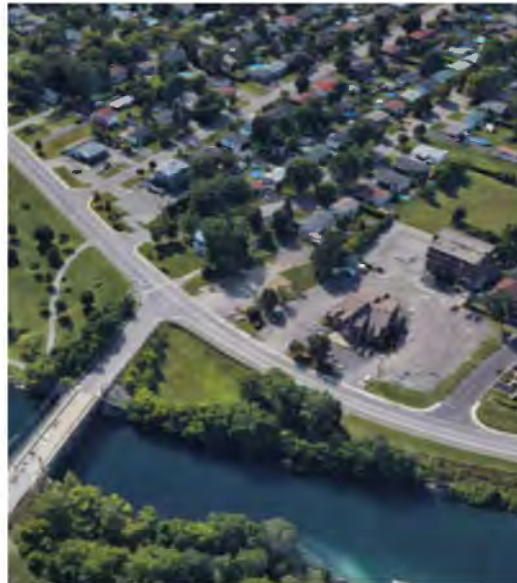
Contexte : Vue aérienne du secteur Kateri et des environs Lieu : Sainte-Catherine.

Un plan d'implantation et d'intégration architecturale est requis pour toute demande de permis de construction ou demande de certificat d'autorisation relative à la modification, à la construction modifiant l'apparence et visible de la voie publique, l'aménagement de terrain, d'accès au terrain ou d'un espace de stationnement sont également assujettis à la présente section.