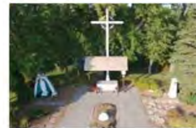
Contexte : Cénotaphe de Kateri de Tekakwitha Lieu : Sainte-Catherine.