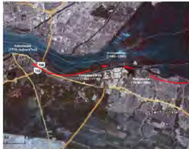
Contexte : Déplacement des missions en provenance de La Prairie : de 1676 à 1690 la mission s'établit sur l'actuel secteur Kateri.