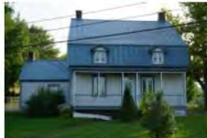
Contexte : La maison Hilaire-Guérin vestige du passé agro-domestique (1750) Source : Ville de Sainte-Catherine