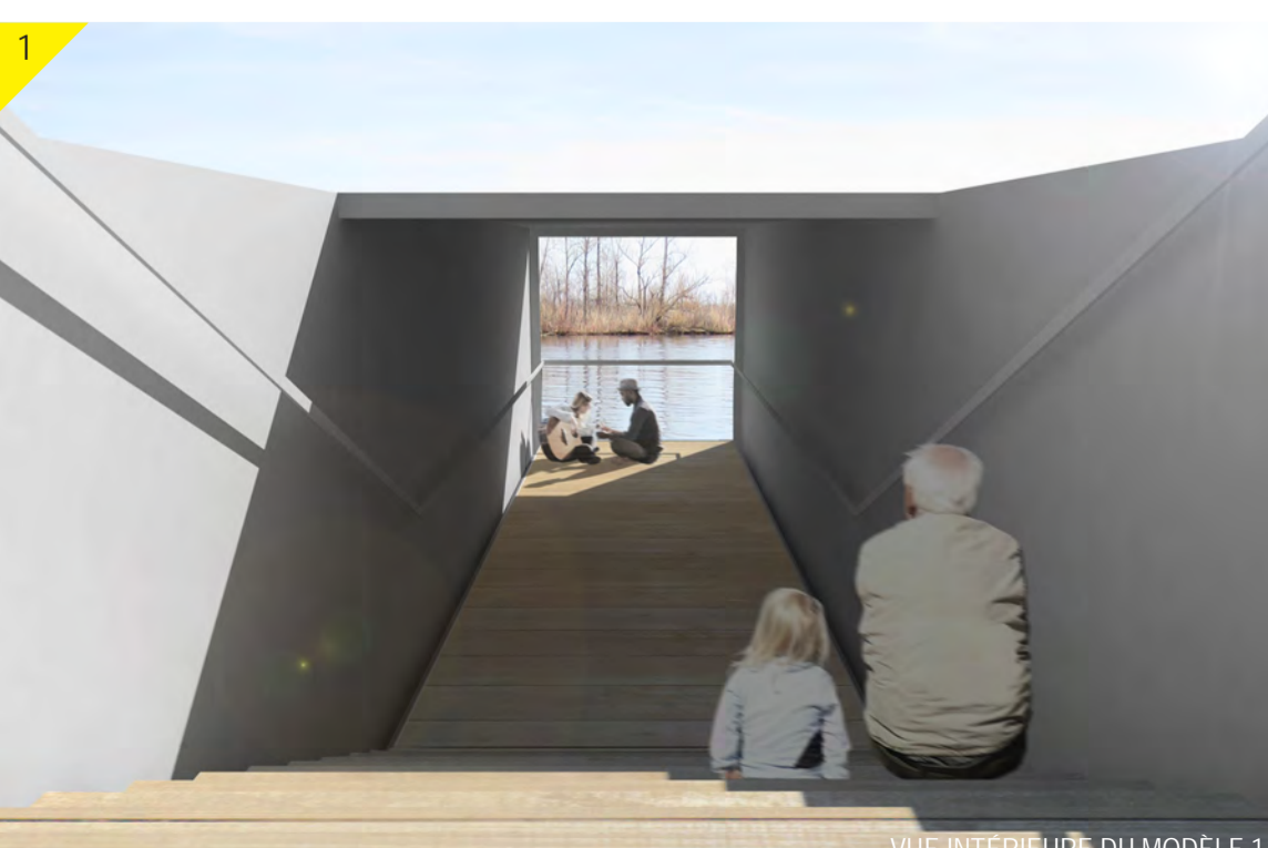
VUE INTERIEURE DU MODELE 1