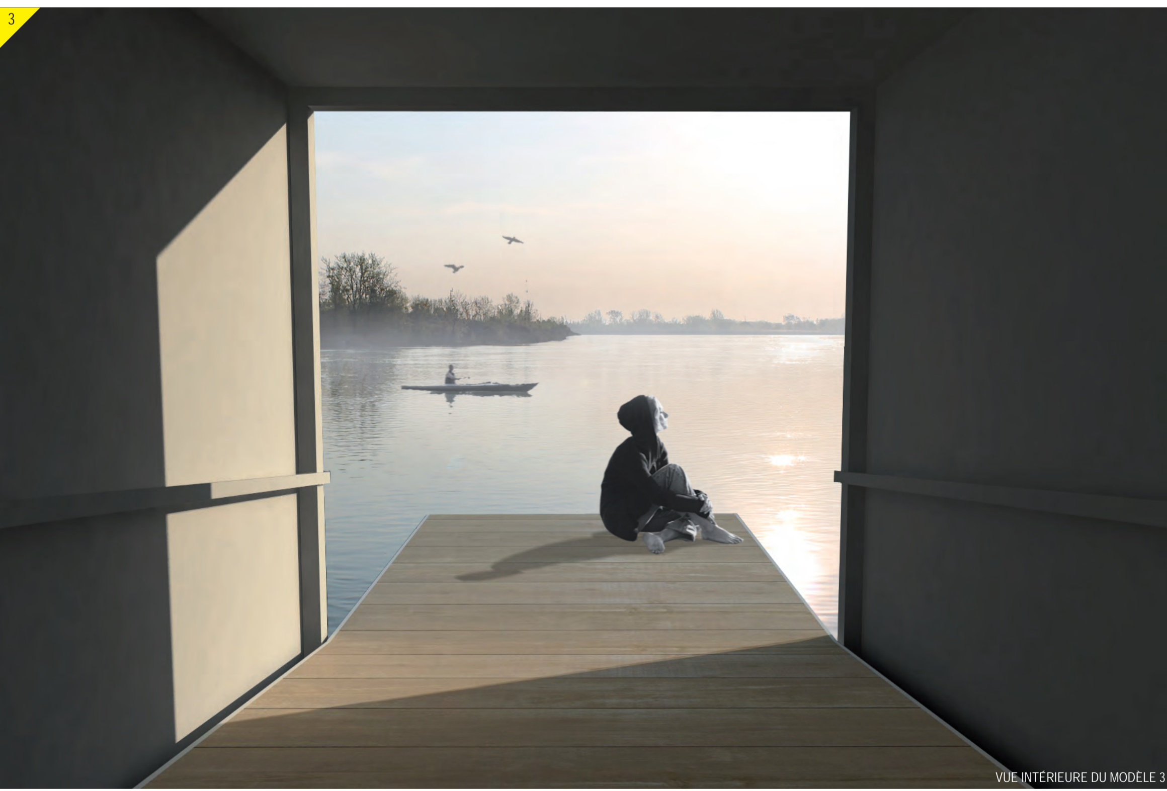
VUE INTERIEURE DU MODELE 3